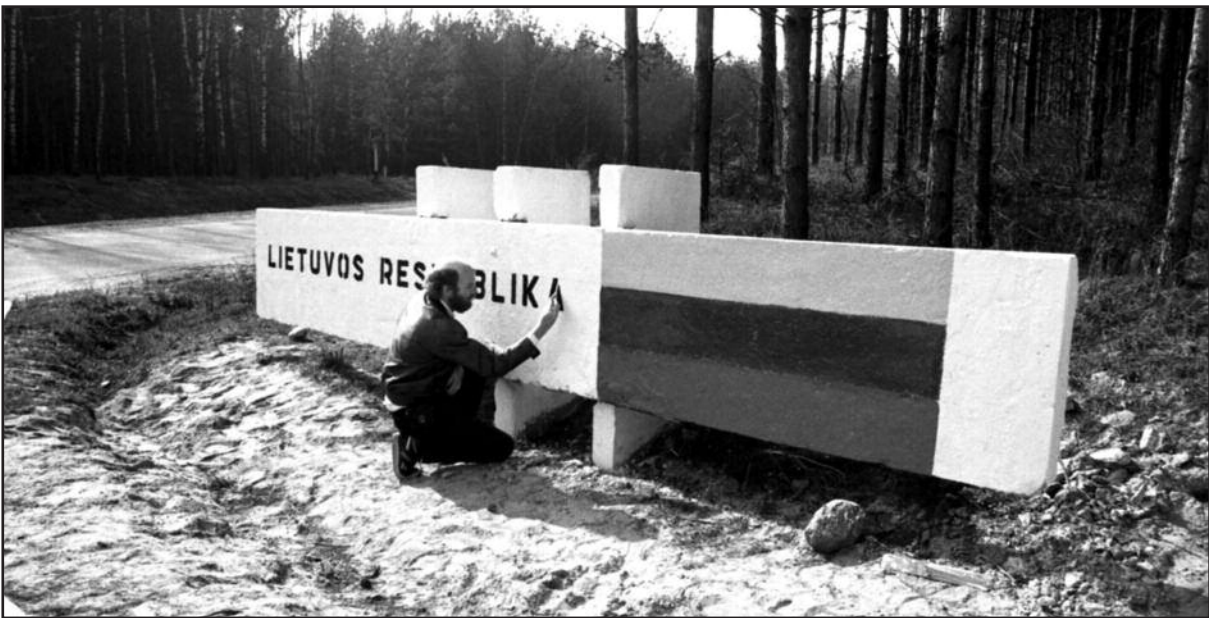
Keičiamas Lietuvos valstybės pavadinimas ant riboženkliaus pasienyje su Baltarusijos TSR. 1990 m. balandžio mėn.

Sausio 13 diena: Pirmasis užsienio reikalų ministras [Sovietų Sąjungos] be manęs iškviatė JAV, Vokietijos, Suomijos, Didžiosios Britanijos ir Italijos ambasadorius. Jis norėjo mums perduoti „žinią“ nuo Gorbačiovo. (...) Jo žinia buvo tokia: „Padėtis Lietuvoje labai aiškiai netenkina masių. (...) Prezidentas Gorbačiovas nori išspręsti susidariusią padėtį vien tik diplomatinėmis priemonėmis. (...) Bet įvykiai vietoje įgauna pagreitį. (...) Buvo sudarytas Gelbėjimo komitetas, su kuriuo Maskvos siųsta delegacija užmezgė ryšį. Šis komitetas, o ne sovietų kariuo-