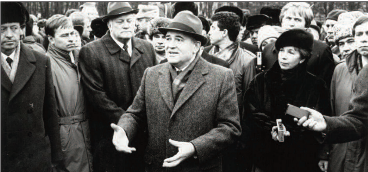
TSKP CK generalinis sekretorius Michailas Gorbačiovas 1990 m. sausio 11 d. susitikime su vilniečiais Vilniuje, Lenino aikštelėje.

Tad Baltijos šalių nepriklausomybės klausimu Prancūzija, vadovaujama Mitterrando, buvo Baltijos šalių pusėje – bet ne visais atvejais ir ne be tam tikrų išlygų. Tol, kol Estija, Latvija ir Lietuva buvo Sovietų Sąjungos dalis, jos galėjo atsiskirti tik besiderėdamos su ja. Nors teisiniu požiūriu jos buvo nepriklausomos, tokios jos nebuvo (ar dar nebuvo) tikrovėje. Todėl su jam būdingu dvilypumu (iš vienos pusės būdamas kovingo būdo, iš kitos – perspėjantis realistas) Mitterrandas simpatizavo Baltijos šalių gyventojams, bet tuo pačiu metu sakė, jog reikėtų suprasti ir Gorbačiovo dilemą – ar jis gali tiesiog imti ir leisti Baltijos šalims būti laisvoms, ar gali elgtis, atsižvelgdamas į būtent tokią tikrovę? Mitterrandas Prancūzijos politiką Baltijos šalių klausimu vedė vadovaudamasis būtent tokiu požiūriu. Nors pašaliečiams ji buvo sunkiai suprantama, Mitterrandui tokia laikysena atrodė logiška. Tokią pat laikyseną jis užėmė ir dėl Vokietijos susivienijimo, ir čia jis buvo nesuprastas. Konfliktas turėjo būti išspręstas, dėl to nebuvo jokių abejonių, bet viskas turėjo būti padaryta taip, kad būtų užkirstas kelias jė-